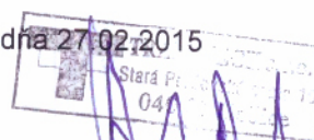
Zhotoviteľ TRADETECH, spol. s r.o. zast: Ing. Pavol Hrehor , konateľ